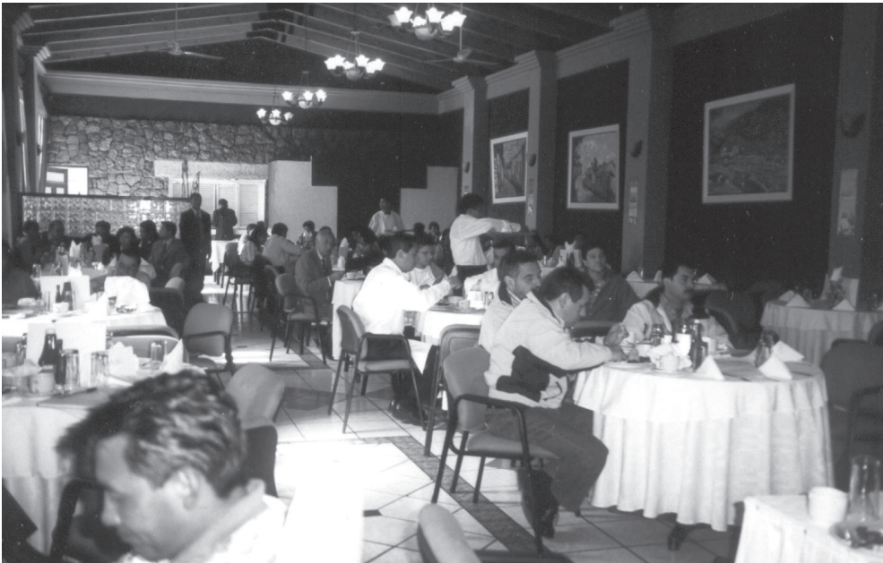
Encuentro con candidatos

Fuente: Encuentro con candidatos a alcalde y diputado de cinco partidos y movimientos políticos, medios de comunicación y organizaciones de la sociedad civil, organizado por la mesa departamental de Quetzaltenango el 11 de septiembre de 2003. Foto tomada por la autora.